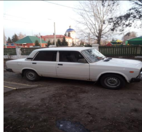
о для фото